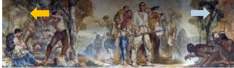
Figura 1: Painel “Do Itálico Berço à Nova Pátria Brasileira”. Parte central, a chegada dos imigrantes; a esquerda a derrubada da mata para implantação de lavoura e construção de casas; a direita, nativos observando a chegada dos imigrantes. As setas apontam a continuidade nas figuras 2 e 3.