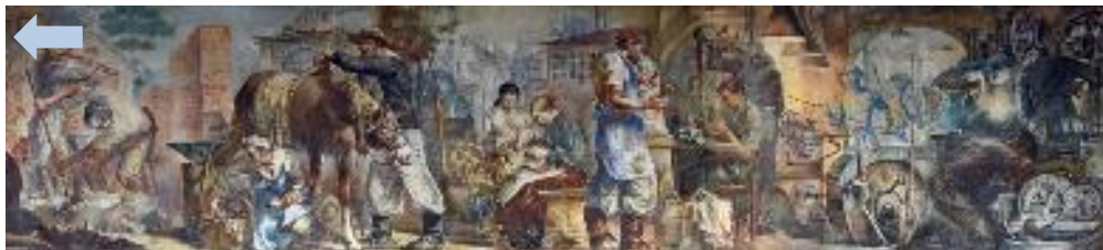
Figura 3: Seguimento, do centro para a direita, o painel mostra a construção civil; o gaúcho e o ferreiro; o trabalho de fiação das mulheres; o escultor e a arte; a indústria metal mecânica. A seta aponta o seguimento na figura 1.