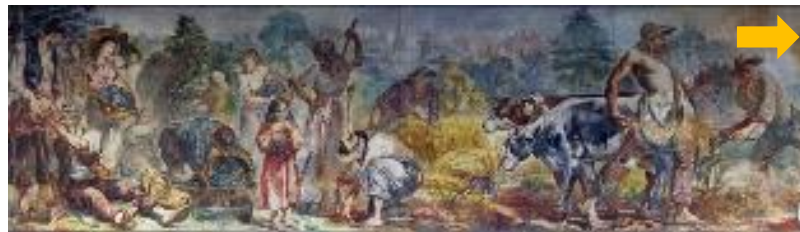
Figura 2: Seguimento, do centro para a esquerda, o painel mostra o preparo e plantio da terra; seguido da vindima, a colheita da uva. A seta aponta o seguimento na figura 1.