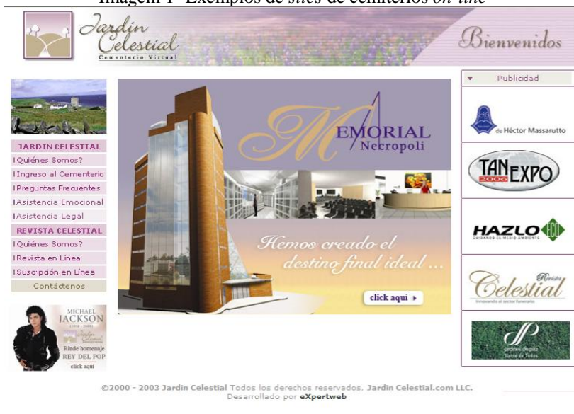
Imagem 1- Exemplos de sites de cemitérios on-line