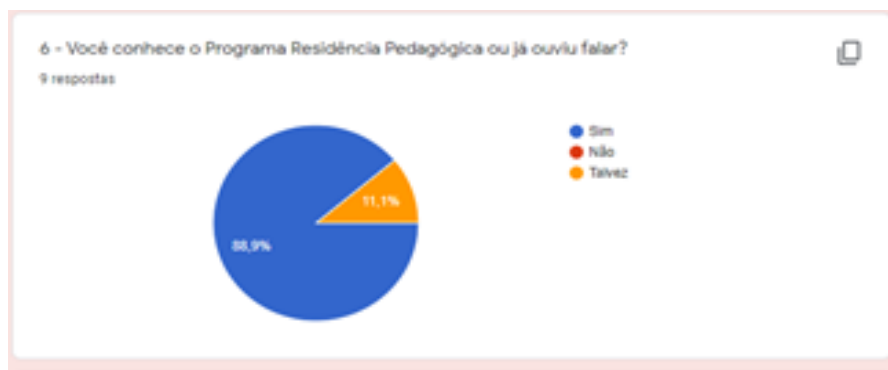
Gráfico 1: Você conhece o Programa Residência Pedagógica ou já ouviu falar?