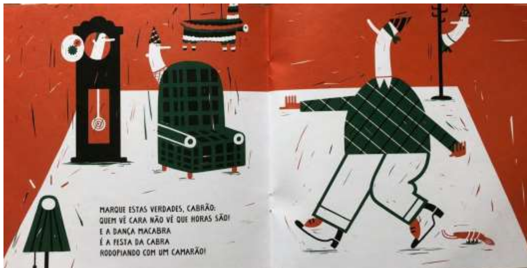
Figura 2 - Dupla de páginas do livro “Limeriques estapafúrdios”

branco e preto; linhas e formas predominantemente circulares dispostas sob uma figura circular em cor branca que vai de um canto inferior a outro demarcando o espaço da ação narrativa. Nesse local há um personagem com corpo desproporcional, pernas e braços finos e curtos e grande corpo redondo, usando um pequeno chapéu, vestindo calça e camisa azul e uma pequena gravata branca. Essa figura se equilibra em um dos pés sobre um banco bem pequeno cujo acento tem a estampa de um coração. Ao mesmo tempo que se equilibra, segura um guarda-chuva com sua mão esquerda e braço esquerdo estendido e um bule de chá na mão direita. O personagem parece estar servindo algo em um recipiente que está sobre o casco de um jabuti que calça sapatos. Próximo da pequena sobrinha, no canto superior direito, uma pinhata está pendurada por dois fios. Desde a capa evidencia-se o humor a partir do ilogismo em uma situação repleta de ações e figuras estapafúrdias.