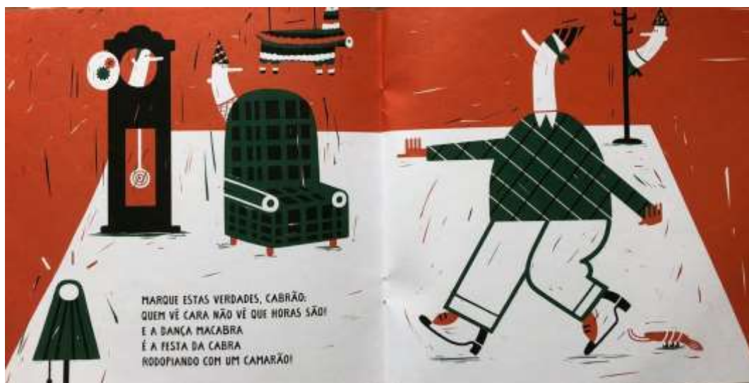
Figura 2 - Dupla de páginas do livro “Limeriques estapafúrdios”

branco e preto; linhas e formas predominantemente circulares dispostas sob uma figura circular em cor branca que vai de um canto inferior a outro demarcando o espaço da ação narrativa. Nesse local há um personagem com corpo desproporcional, pernas e braços finos e curtos e grande corpo redondo, usando um pequeno chapéu, vestindo calça e camisa azul e uma pequena gravata branca. Essa figura se equilibra em um dos pés sobre um banco bem pequeno cujo acento tem a estampa de um coração. Ao mesmo tempo que se equilibra, segura um guarda-chuva com sua mão esquerda e braço esquerdo estendido e um bule de chá na mão direita. O personagem parece estar servindo algo em um recipiente que está sobre o casco de um jabuti que calça sapatos. Próximo da pequena sobrinha, no canto superior direito, uma pinhata está pendurada por dois fios. Desde a capa evidencia-se o humor a partir do ilogismo em uma situação repleta de ações e figuras estapafúrdias.