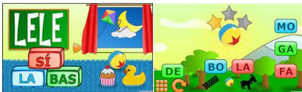
Figura 2 – Jogo Lelê Sílabas