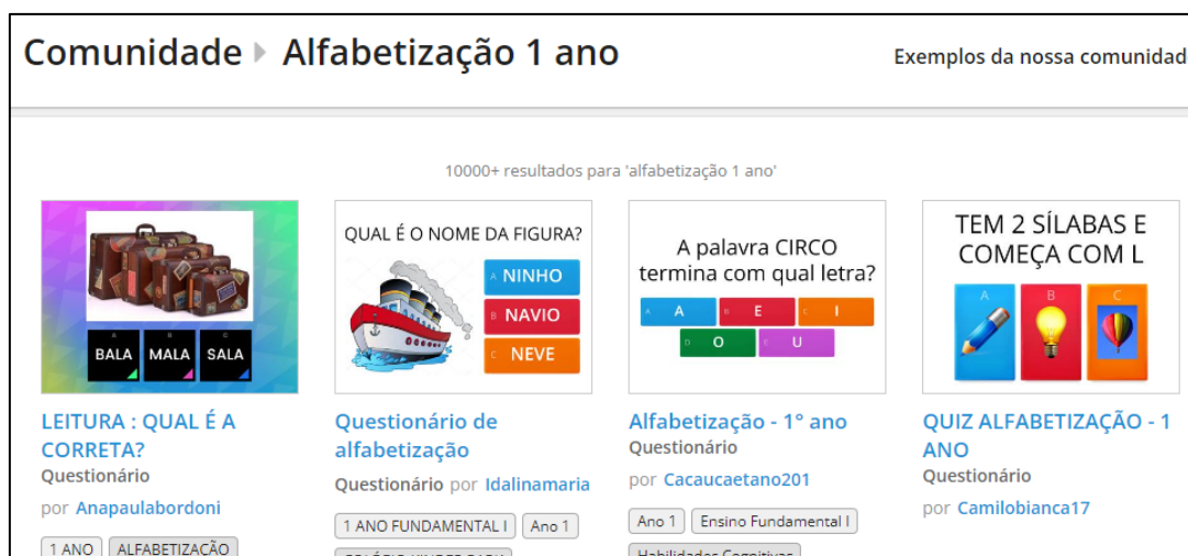
Figura 4 – Site Wordwall