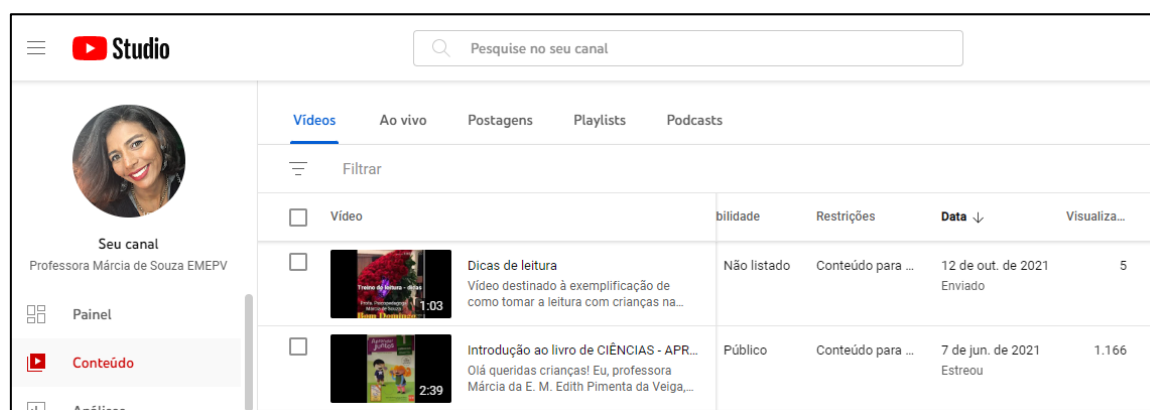
Figura 6 – Plataforma do meu canal no Youtube

Outra TDIC que aprendi a utilizar no período pandêmico, foi o canal no YouTube (Figura 6). Utilizei e ainda utilizo para produzir conteúdo específico para trabalhar com a minha turma. Por exemplo: fiz um vídeo das crianças em diversas atividades e apresentei na reunião de pais. O acesso ao vídeo é restrito às famílias que recebem o link de acesso, pois o YouTube proporciona opções de acessibilidade. Na minha percepção é uma ferramenta que permite curadoria digital, tanto para as crianças, quanto para suas famílias. É uma ferramenta mais complexa que, demanda mais tempo para a produção de conteúdo. Entretanto, é válido colocar a sua utilização em pauta, ao pensar nas possibilidades de uma alfabetização e letramento digital na perspectiva de um processo discursivo (FRADE, 2014; SMOLKA, 2014; SOARES, 2020, 2014).