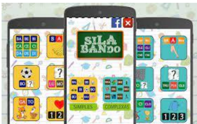
Figura 3 – Visualização das imagens de abertura do aplicativo Silabando